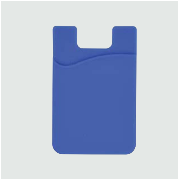
TEC 252 Mobile Stark