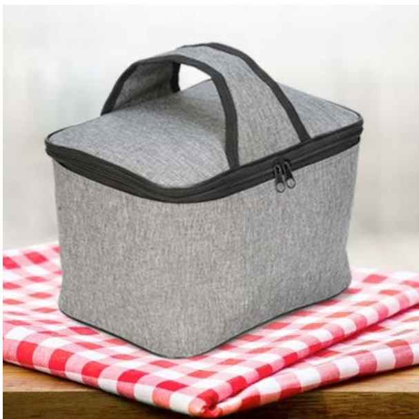
MAL 114 Lonchera Milton