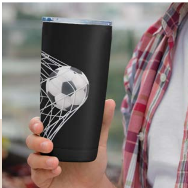
TH 07 Termo Vitex