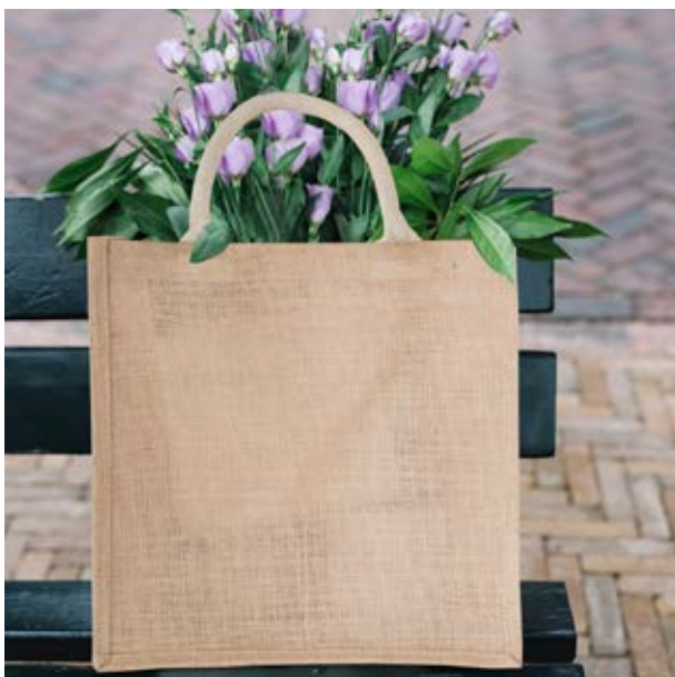
MAL 10 Bio Hand-Bag