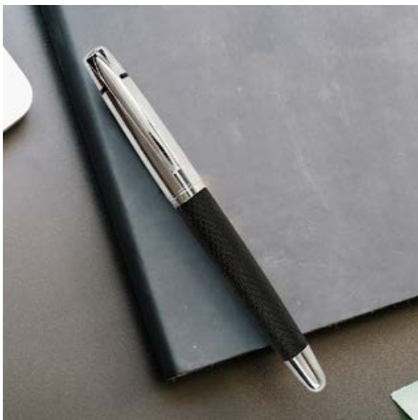
BOL 522 Bolígrafo Turner