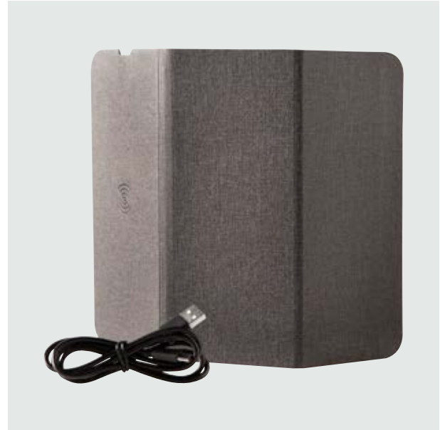
TEC 102 Mousepad Planck