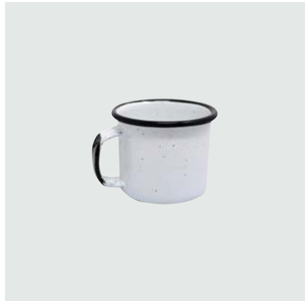
TH 212 Shot-Tequilero