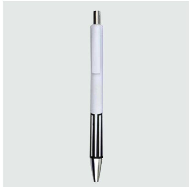
BOL 23 Bolígrafo Chagall