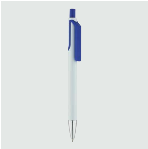
BOL 20 Bolígrafo Cuevas