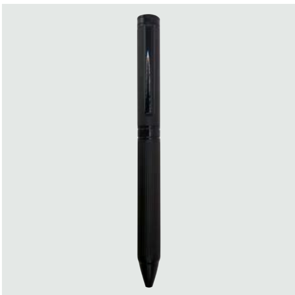
BOL 526 Bolígrafo Carrington