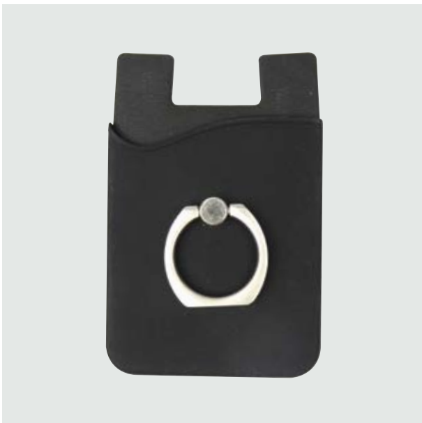
TEC 257 Mobile Tesla